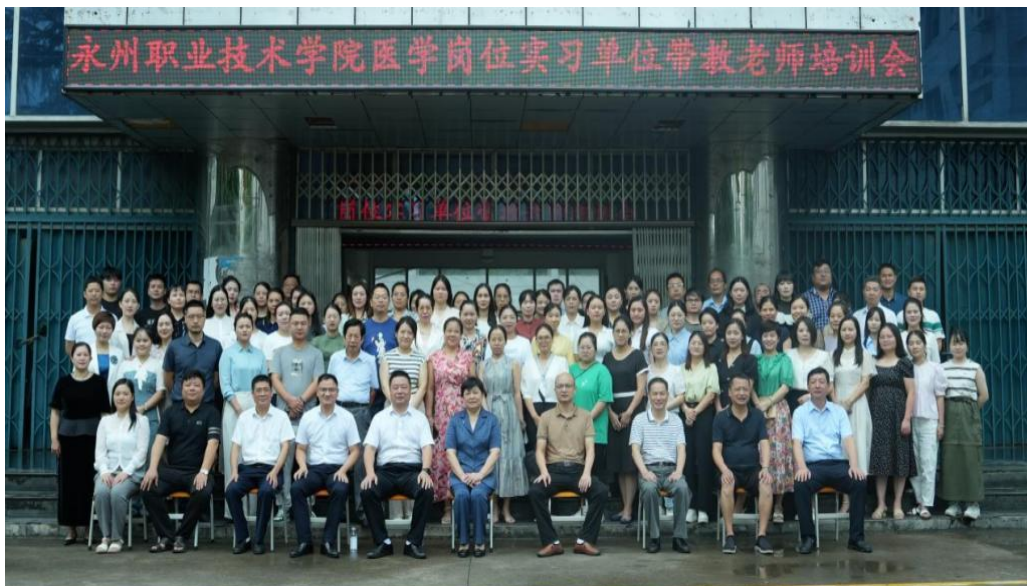
图 1 医学岗位实习单位带教老师培训会

为加强医学人才的培养质量，确保医学岗位实习教学的规范化、标准化和同质化，全面提升医学岗位实习单位带教老师的教学素养和能力水平，2024 年 9 月 20 日-22 日医学院与护理学院联合举办了医学岗位实习单位带教老师培训会。本次会议共有 30 余家校外实习单位的 70 余名带教老师参加，会期两天。会议邀请了中南大学湘雅医院、湖南中医药大学、南华大学、湖南雅贝康口腔医疗集团有限公司的 4 家医院和企业的专家，及 3 位校内专家为实习医院带教老师授课。