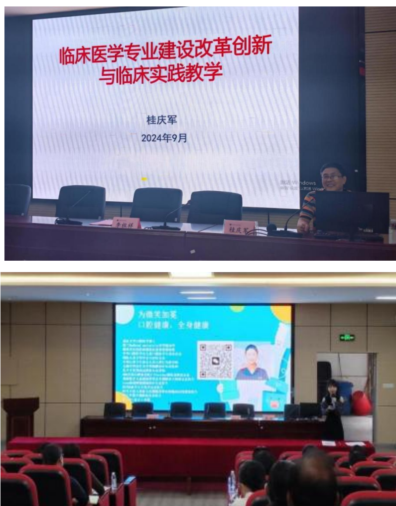
图 2 专家授课

2. 开展医学教育新理念培训，让带教老师了解最新的医学教育发展态势和相关要求，如以岗位胜任力为导向的医学教育模式，促使带教老师将这些理念融入到日常教学中，培养出更符合临床实际需求的医学人才。