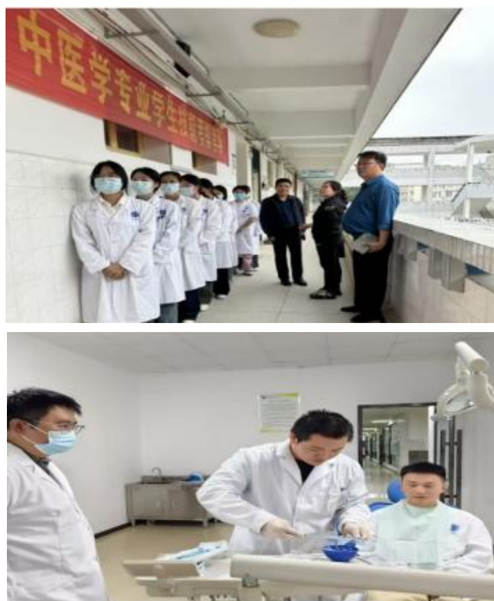
图 4 学生技能抽考现场

医学院通过一系列举措，包括召开实习医院带教老师培训会、组织召开各专业建设指导委员会暨专业人才培养方案论证会、组织院内学生技能抽考工作等一系列举措，全面狠抓教学质量，取得了良好的效果。在今后的工作中，医学院将继续坚持以教学质量为核心，不断创新教学方法和手段，加强教学管理和师资队伍建设，为培养更多优秀的医学专业人才而努力奋斗。