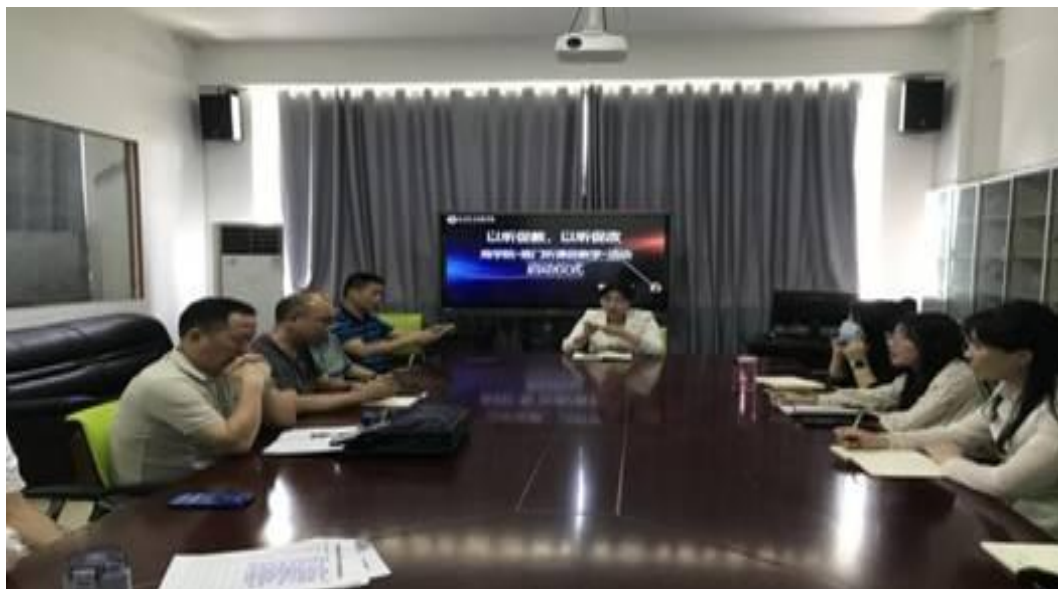
图 1 商学院召开活动筹备会议