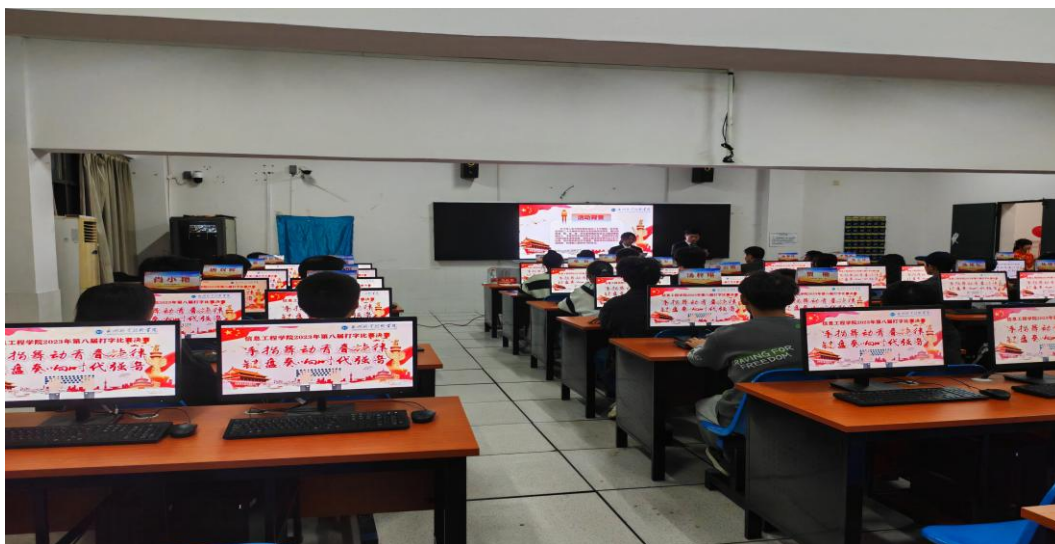
图 1 新生打字比赛

学生专业基础能力不过关，是制约学生专业技能提升，造成学生厌学的主要原因。我们遇到的极端案例是，有学生直到毕业时都是一根手指弹键盘。对此，信息学院实施强基计划：根据计算机专业特点将文字录入、信息处理、程序设计、数据库操作等 4 个方面的能力作为专业基础能力，多措并举加强培养。一是针对大一新生坚持每周 3 个晚自习开放机房，安排专业教师义务轮班，指导和督促学生进行训练，帮助新生尽快跨过文字录入门槛，尽早建立专业学习兴趣。二是开展专业基础能力竞赛，对应 4 个专业基础能力，多年坚持举办“新生打字比赛”、“PPT 设计与演讲比赛”、“程序设计比赛”、“数据库操作技能赛”，通过以赛促学，达到了建设专业文化、增强学习兴趣、检查学习效果的目标。三是将专业基础能力纳入专业技能考核标准，将基础能力训练前置，融入课堂教学，及时有效提升学生专业基础能力，为专业核心课程学习，专业核心能力形成打下坚实基础。（见图 1）