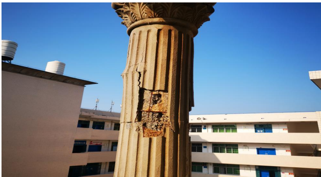
图 3 医技楼后栋教学楼柱子开裂图片