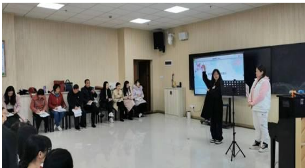
图 2 商学院组织教师推门听课

领导小组按照听课计划，随机抽取了商学院各专业的课程进行听课。听课过程中，领导小组成员认真观察教师的教学过程，记录教学情况，并与学生进行互动交流。课后，领导小组成员还与教师进行了反馈交流，指出了教学中的优点和不足，提出了改进建议。