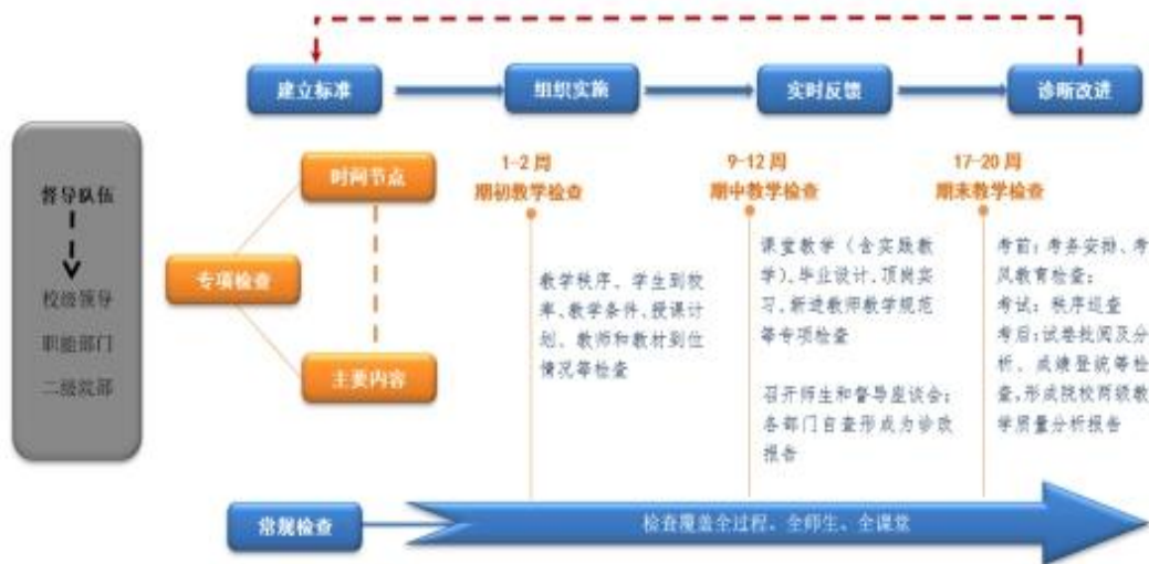
图 1 教学检查

建立教学常规检查制度，主要包括定期检查、专项检查、教务处日查、二级学院（部）日查、部门领导巡查等方式，贯穿于整个教学过程，检查内容涵盖教学运行情况和教学基本建设情况等。