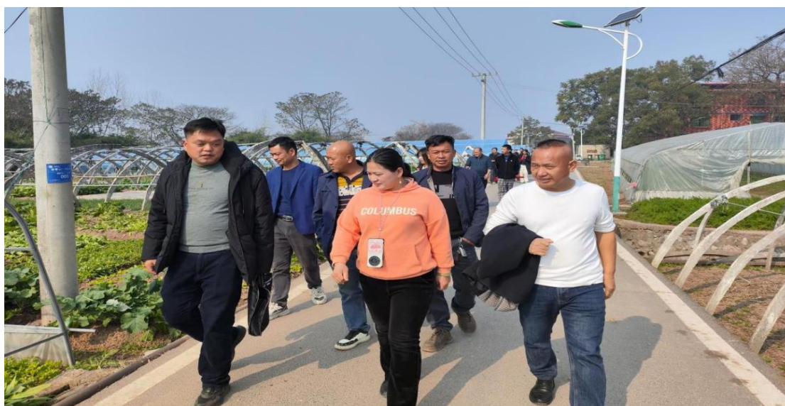
图 2-7 培训学员到田间课堂学习蔬菜栽培技术

永州职业技术学院积极响应国家政策，创新农民培育模式，聘请农业专家、农业技术人员、农业院校教师等具备丰富实践经验和教学能力的专业人士担任培训讲师，积极开展农民技能培训和高素质农民培育工作（见图 2-7）。培训重点聚焦农民增收、农民技能等方面，采用集中培训、现场教学、实践教学、网络教学等多种培训方式，打造固定课堂、田间课堂、观摩课堂“三个课堂”，满足不同层次、不同需求的农民培训需求。2023 年，已开展 9 期，培训 3850 人次，为永州市现代农业发展和乡村振兴战略的实施提供了有力的人才保障。