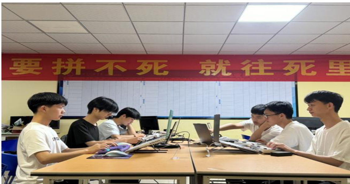
图 3 学生竞赛培训