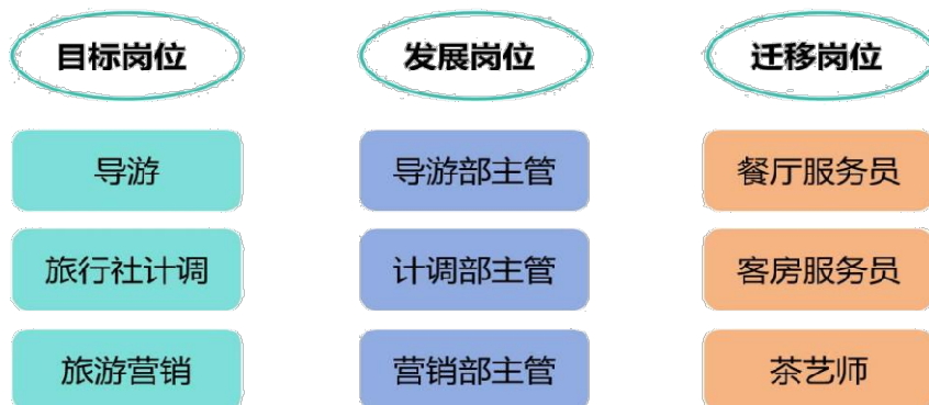
图 1 职业发展路径图