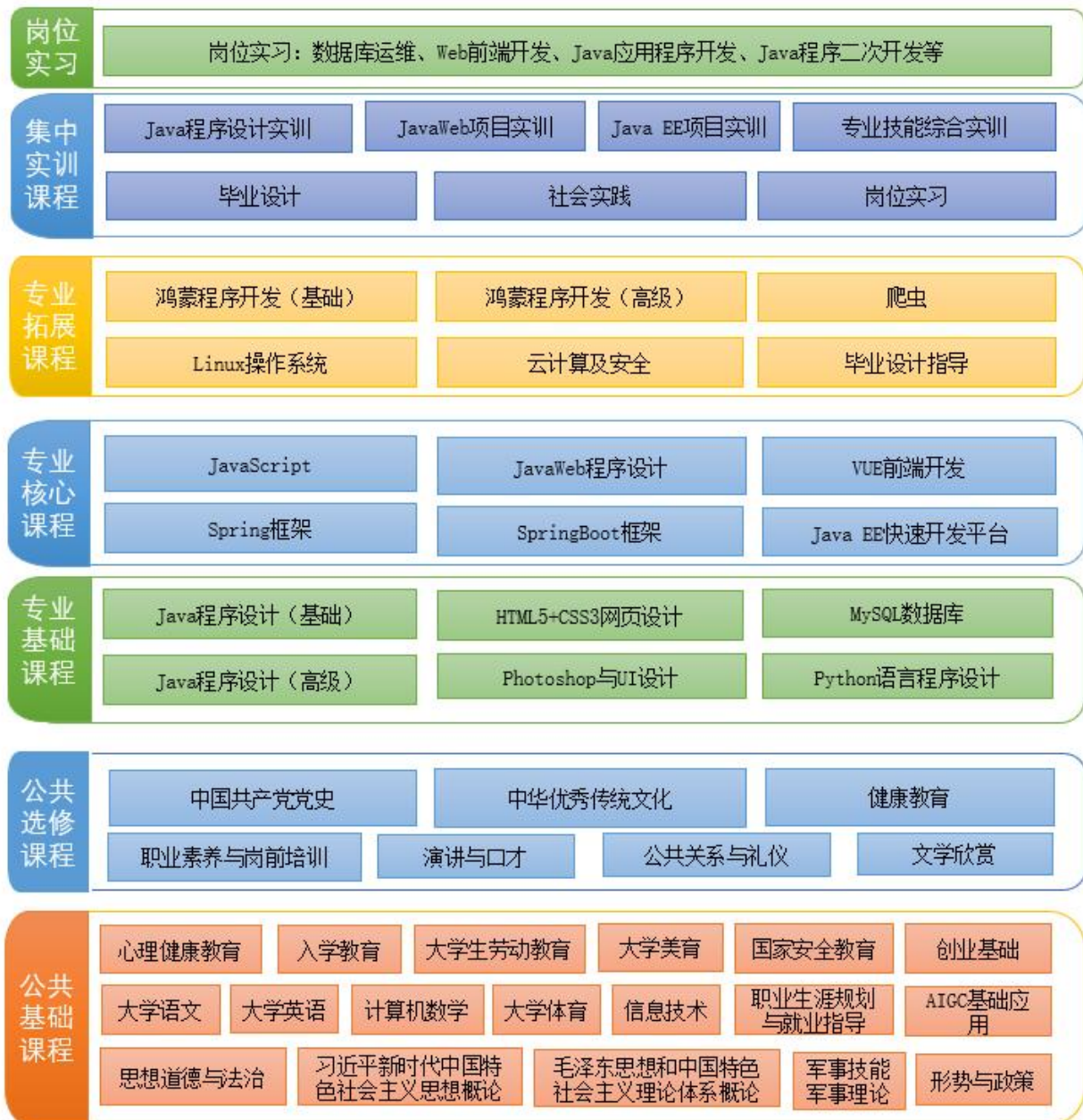
图 2 课程体系