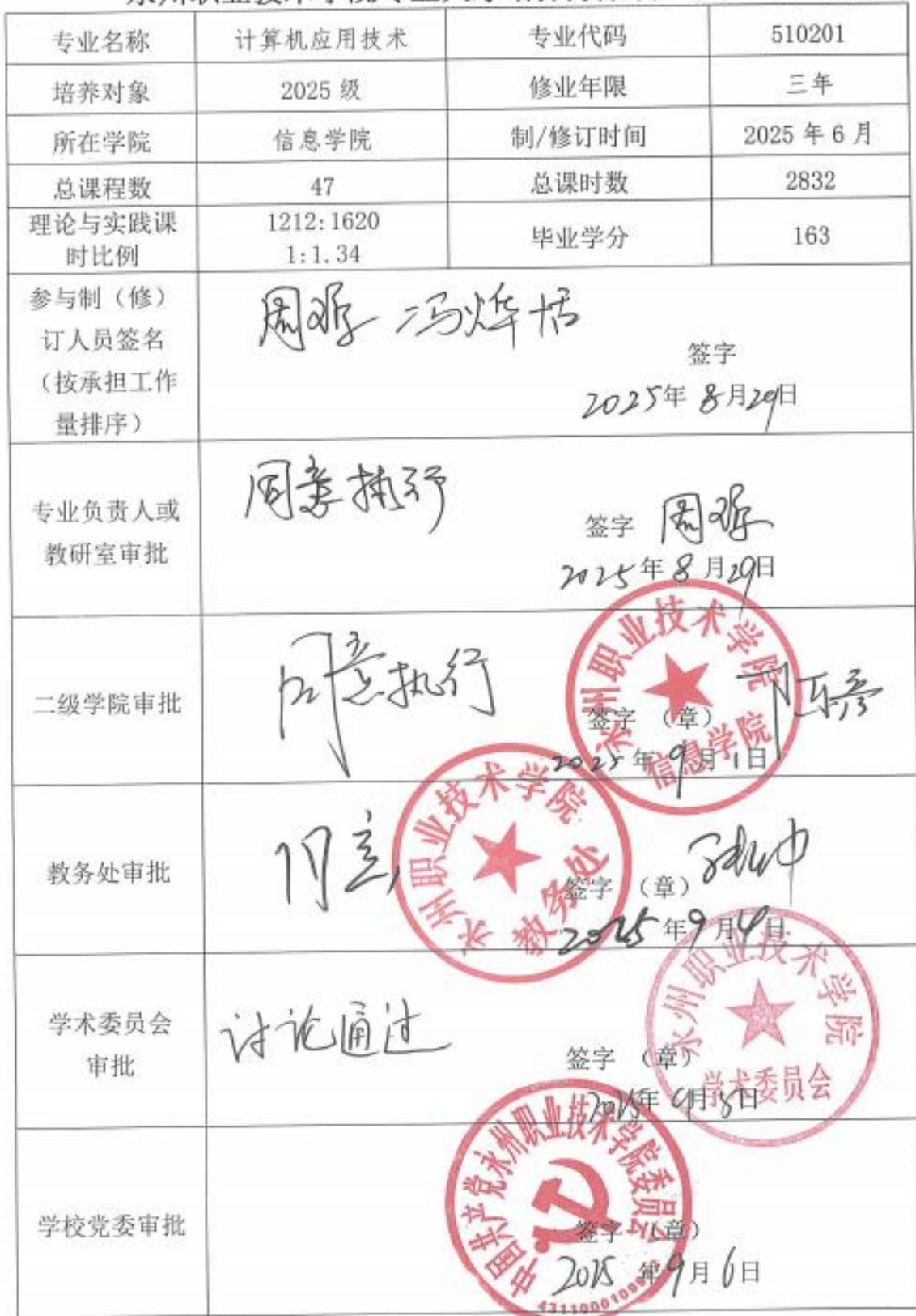
永州职业技术学院专业人才培养方案制（修）订审批表