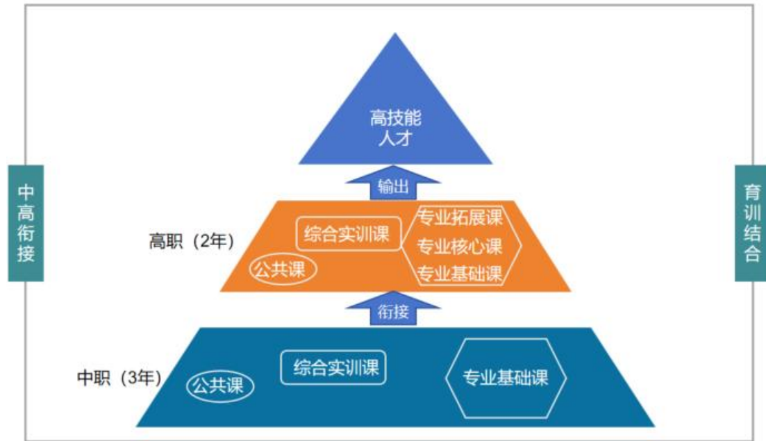
图 2. “中高衔接，育训结合”的专业课程体系