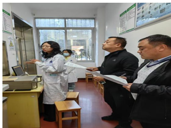
医学影像技术专业教师 实践教学考核

参与考评的教师准备充分，态度认真。各组评委对标专业实践教学考核评分标准，逐一对新教师教学过程、技能操作要点、职业素养等方面进行了细致的点评和指导，并从教学设计、课程思政等方面提出具有针对性的意见和建议。希望各位新教师在今后的教学中，能把精益求精、勇于创新的职业素养融入学生的技能培养，力求实现学生匠心养成的培育过程与学生成长发展的同频共振。