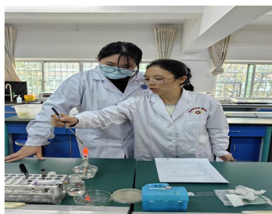
评委现场指导新教师 灭菌接种环操作要点