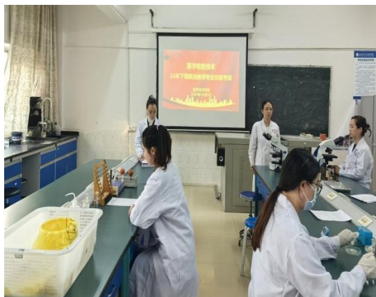
医学检验技术专业教师 实践教学考核

考评分四组进行，以教师实际授课的一门课程为基础，通过 30 分钟的操作与讲解，呈现实践教学流程、内容设计及内容组织等多个环节。考评对象为学院 24 年新入职的八名教师，邀请业务精湛的教师担任评委，现场评分。