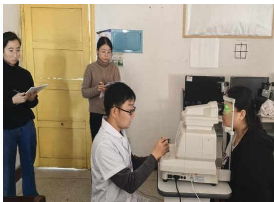
眼视光技术专业教师 实践教学考核