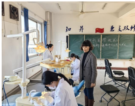
口腔医学技术专业教师 实践教学考核