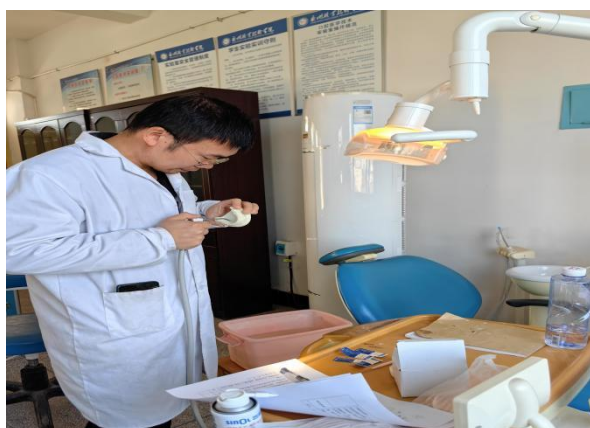
评委考核新教师制作的 牙体预备作品

参与考评的教师准备充分，态度认真。各组评委对标专业实践教学考核评分标准，逐一对新教师教学过程、技能操作要点、职业素养等方面进行了细致的点评和指导，并从教学设计、课程思政等方面提出具有针对性的意见和建议。希望各位新教师在今后的教学中，能把精益求精、勇于创新的职业素养融入学生的技能培养，力求实现学生匠心养成的培育过程与学生成长发展的同频共振。