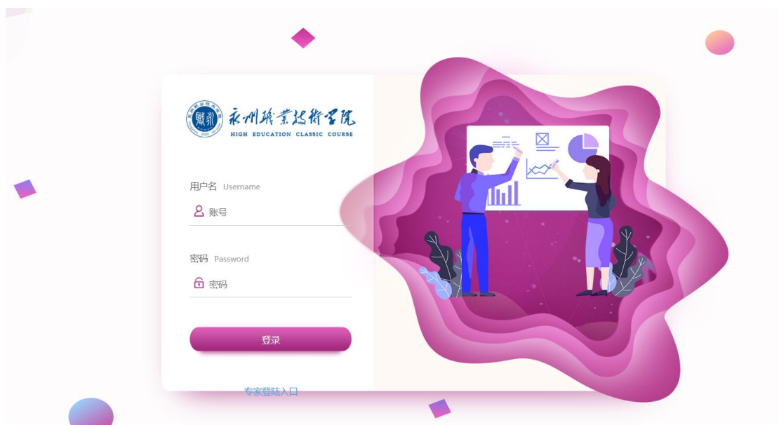
图 2 永州职业技术学院毕业设计管理平台

今年毕业设计评审平台由世界大学城改为湖南星云网络信息技术有限公司开发的毕业设计管理平台，通过网络答辩合格的学生毕业设计任务书和学生毕业设计成果由学院统一收集好电子材料，所有 2020 届毕业生毕业设计成绩经本学院院长签字认可，合格的三年制毕业设计任务书和学生毕业设计成果由指导老师按照安排学生→安排选题→上传最终文档→文档评审通过流程统一上传至学校毕业设计管理平台（图 2）。